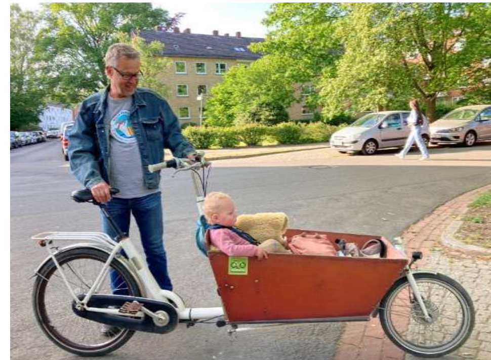
Wochenendausflug mit Familie