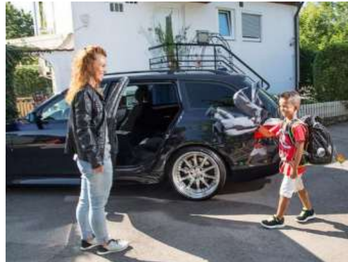
“Elterntaxi” zur Schule oder zum Kindergarten