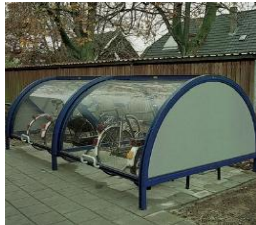
Cupola per biciclette con un design trasparente e più leggero. 3