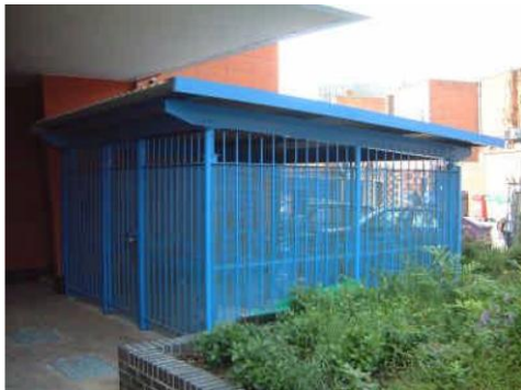
Depositi esterni per biciclette sicuri e ben visibili per appartamenti Porsmouth, UK

Le città stanno sperimentando sempre più le potenzialità dei nuovi quartieri sostenibili, spesso concepiti come aree a traffico limitato . Il principio di base prevede di riservare almeno una parte delle abitazioni a persone che non dispongono di un'auto, ma che, in cambio, hanno accesso a un'ampia scelta di mezzi di trasporto alternativi, inclusi trasporti pubblici, auto condivise (car sharing) e naturalmente biciclette.