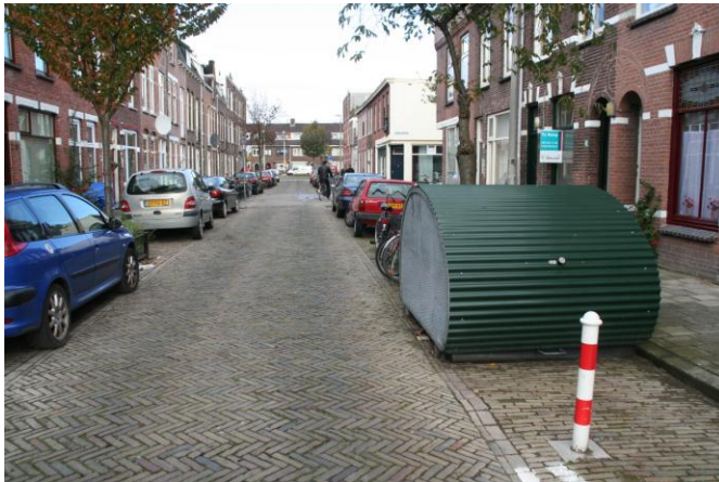
Una cupola per biciclette sulla corsia di parcheggio di una strada residenziale, con un dissuasore che ne protegge l'accesso. Utrecht, NL 2