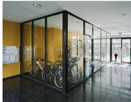
Il nuovo quartiere "Bike city" a Vienna fa onore al suo nome.