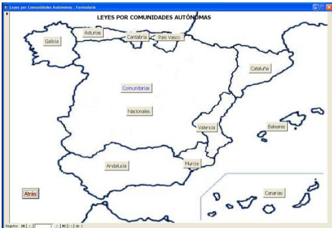
Imagen 3: pantalla para acceder a las legislación principal identificada en las distintas CCAA

En esta imagen se muestran las leyes mencionadas en cada CCAA, así como las de aplicación general por ser estatales o comunitarias. Para volver al menú principal no hay más que presionar sobre el botón “Atrás”. Al pulsar sobre cualquiera de los botones con el nombre de una comunidad o en los de “Estatales” y “Nacionales”, se muestra una tabla como la siguiente, que permite el acceso a los textos de las leyes, además de un pequeño resumen.