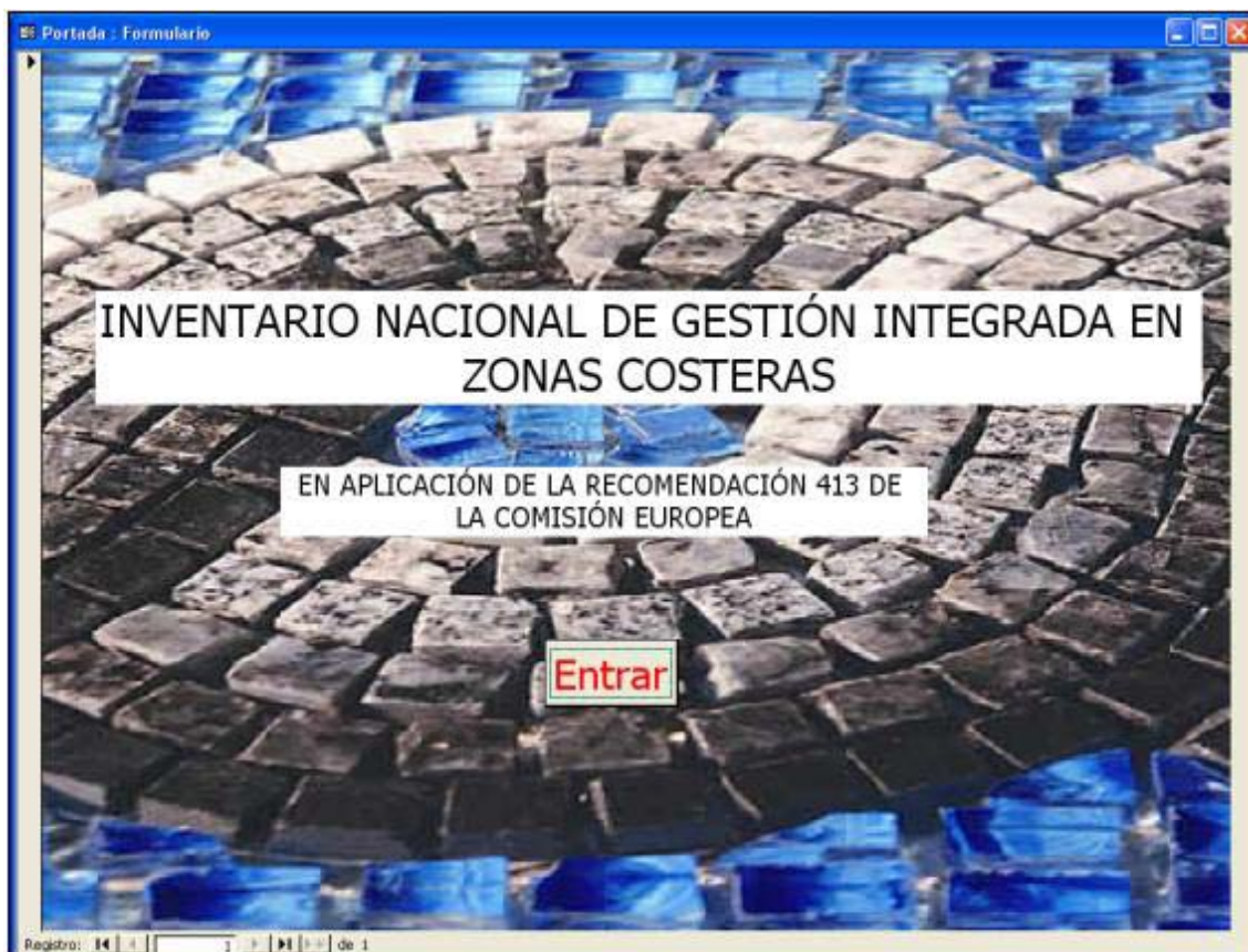
Imagen 1: portada del proyecto

La base de datos ha sido diseñada de forma que su uso sea sencillo e intuitivo, a continuación se muestran las distintas interfaces que hallará el usuario de la misma, y la información que podrá visualizar en las mismas. Al abrir la base de datos, aparece la siguiente portada: